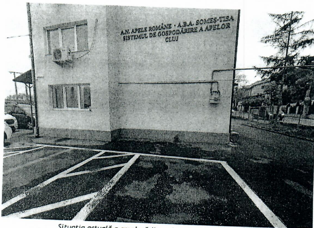
Situația actuală a amplasării conductei de gaz (Foto 18.04.2024)

Luând în considerare toate argumentele expuse anterior, considerăm imperios necesară mutarea conductei de gaz metan în exteriorul clădirii pentru evitarea unui posibil accident.